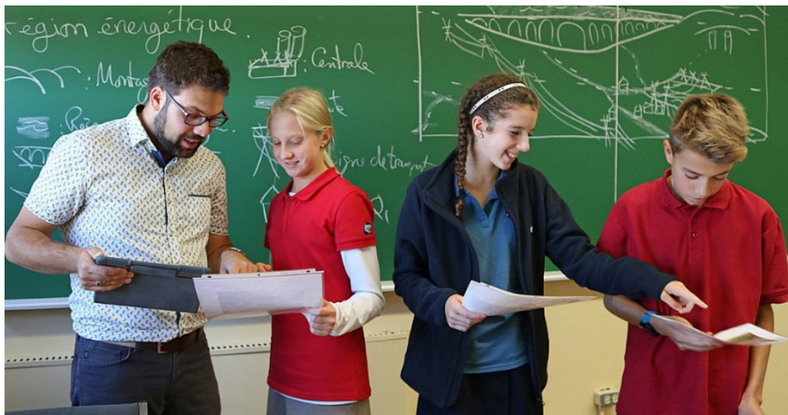
L'enseignant et ses élèves

élèves écrivent en équipe un texte sur les apports de l'écriture qui constitue le deuxième chapitre de l'atlas historique. Ils doivent, en équipe, répondre à la question suivante : « Comment l'invention de l'écriture cunéiforme a-t-elle influencé la civilisation mésopotamienne lors de l'Antiquité? ». Dans leur introduction, les élèves précisent les repères spatio-temporels et, dans leur conclusion, ils abordent les héritages légués par les Mésopotamiens à la civilisation occidentale. Chacun des aspects abordés dans le développement doit être étayé de faits historiques et accompagné d'au moins un document historique étudié dans le cours. Ces documents sont parfois écrits, relèvent parfois de l'iconographie ou peuvent être des objets usuels ou des artefacts retrouvés par des archéologues. Par exemple, les élèves vont analyser et décoder des sculptures présentant des personnages ou des documents écrits en cunéiforme et traduits en français d'aujourd'hui (Code de loi du roi Hammourabi, tablette de comptabilité en argile), des ruines de temples anciens (Ziggourat d'Ur), des textes mythologiques (Épopée de Gilgamesh) ou des documents iconographiques présentant les exploits militaires d'un roi (Étendard d'Ur). Chaque document historique est ainsi associé aux concepts étudiés.