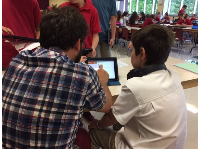
Un élève de la classe travaillant sur son atlas historique avec l'aide de l'enseignant