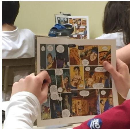
Les élèves lisant la bande dessinée Démocratie avec leur enseignant

à travers les dialogues et les images riches de sens. Chaque élève a une copie de la bande dessinée en question et la lecture à voix haute médiatisée se déroule sur environ trois cours. L'enseignant mentionne qu'il est particulièrement intéressant de faire observer aux élèves le graphisme de cette œuvre de fiction historique et de les comparer avec des photos d'un voyage qu'il a fait en Grèce puisque les auteurs ont tenté avec succès de reconstituer des paysages, des lieux publics et des bâtiments d'une manière fidèle à ce qu'ils étaient à l'époque. La lecture de l'enseignant est accompagnée de plusieurs explications données aux élèves à propos de la démocratie athénienne.