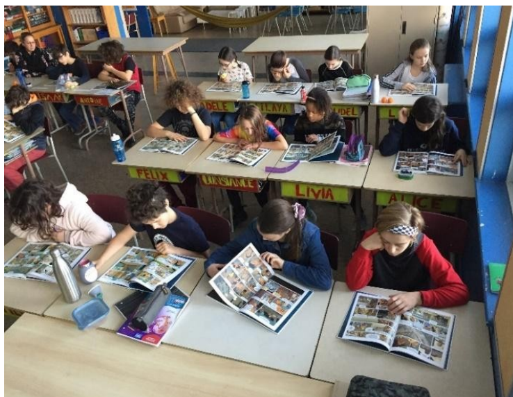
Lecture d'une bande dessinée en classe 5

La première étape du projet visait à prendre contact avec la culture liée à la BD en plus de l'apprentissage de ses différents codes. Pour y parvenir, il fallait d'abord donner accès à des ouvrages. Comme la classe était assez grande, l'enseignant et les élèves ont réfléchi à la création d'un coin lecture dédié à la BD. Du mobilier a été acheté et celui-ci a été garni par des ouvrages empruntés du LIMIER et proposés par les chercheurs et l'enseignant. Plusieurs titres s'y trouvaient réunis. Lors des périodes de lecture, les élèves pouvaient venir y lire ou simplement se chercher un livre.