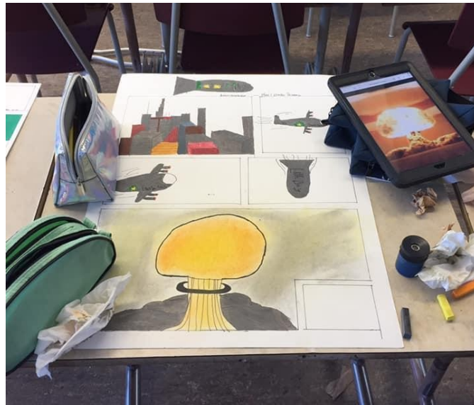
Réalisation des illustrations de la bande dessinée © Groupe de recherche en littératie médiatique multimodale

pointe fine. Le coloriage des personnages et des éléments importants des cases se faisait au crayon de couleur de bois. Le fond des cases était quant à lui colorié à l'aide de pastel sec.