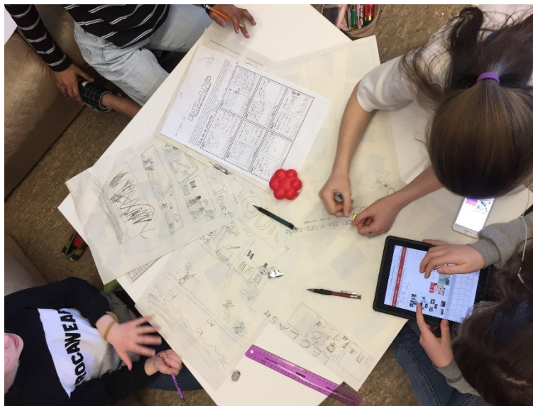
Réalisation du brouillon de la bande dessinée

C'est à cette étape que tout le travail réalisé en amont a permis aux élèves d'intégrer leurs connaissances en lien avec la BD et la multimodalité, leurs connaissances acquises sur la période historique touchée en classe et la recherche documentaire à caractère historique effectuée lors de la réalisation du portfolio numérique d'inspiration. En effet, c'est pendant cette partie du projet que les élèves devaient correctement situer leur sujet d'étude en reproduisant le plus fidèlement possible des indices visuels géographiques et historiques repérés lors de la réalisation du portfolio numérique d'inspiration. L'objectif à poursuivre était le suivant : illustrer correctement l'époque choisie en respectant le découpage de l'histoire qui avait été fait lors de l'étape de la scénarisation. C'est donc ici que les élèves devaient retourner à leur portfolio numérique d'inspiration afin de s'assurer de la cohérence des indices visuels qu'ils illustraient avec ceux qu'ils avaient répertoriés lors de la recherche documentaire.