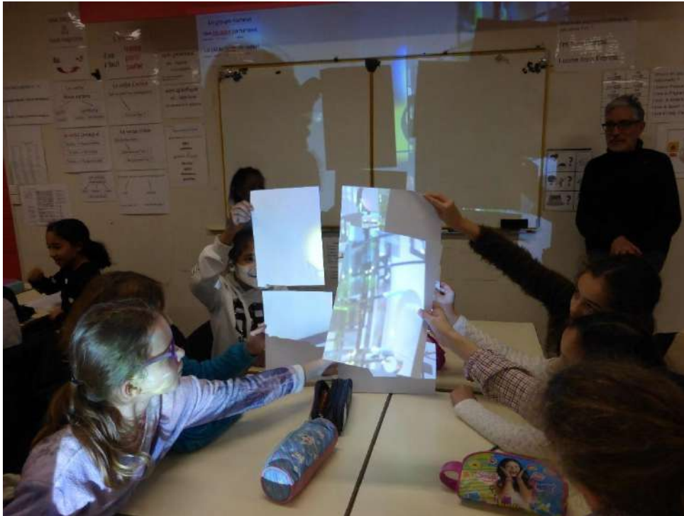
Illustration 3. En classe de CM1, jeu spontané avec une projection d'œuvre de Nicolas Schöffer

Ensuite, l'enseignant demande de déterminer les mots-clés qui permettent de décrire l'œuvre de Schöffer. Les élèves répondent « couleur », « formes géométriques », « reflets », « mouvement », « lumière ». Cette liste constitue le cahier des charges de la séance suivante, pour laquelle les élèves apporteront du matériel et feront une sculpture +ÀLMD Nicolas Schöffer. Puisqu'ils ne disposent pas des moyens techniques de l'artiste (métal, moteurs, dimensions monumentales), ils sont amenés à se débrouiller et à chercher des solutions qu'ils puissent eux-mêmes mettre en œuvre.