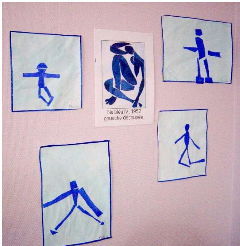
Illustration 1. Travaux d'élèves de CM1 1 à la manière de Matisse

Tous les professeurs des écoles (PÉ) ont entendu parler, ou même pratiqué, le « À la manière de » (ÀLMD). C'est un scénario didactique très courant en arts plastiques et visuels (APV) à l'école primaire, qui consiste en l'articulation d'une pratique plastique de l'élève à une référence artistique préalable choisie par l'enseignant, sous la forme d'un exemple à suivre, d'un modèle à imiter. Concrètement, l'enseignant montre une œuvre aux élèves, sous la forme d'une reproduction (affiche ou image numérique projetée sur écran), puis leur demande de la reproduire avec plus ou moins de latitude.