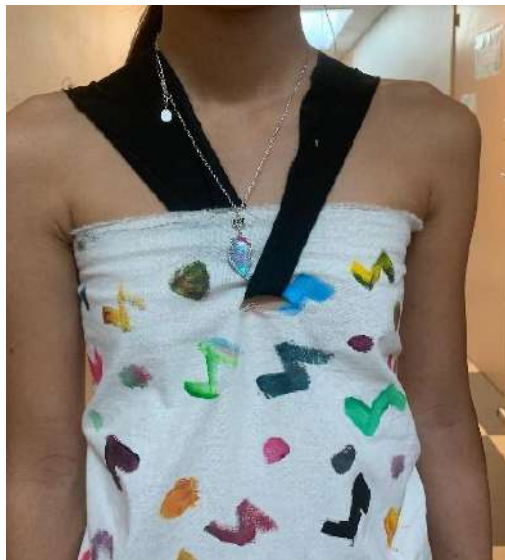
Illustration 6. Travail d'élève de CM1 +ÀLMD Yves Saint Laurent

En fin de séquence, les élèves peignent sur de grandes toiles libres de coton des motifs mûrement réfléchis, et créent un vêtement avec cette toile peinte en la drapant directement sur le corps d'une camarade (voir illustration 6). Les machines à coudre servent à fixer la forme ainsi déterminée. Du point de vue de la peinture, personne n'a refait du Mondrian ni du Memphis; tous les élèves ont tenu à faire quelque chose qui soit vraiment à eux.