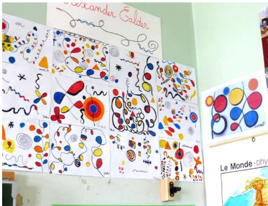
Illustration 2. Travaux d'élèves de CM1 à la manière de Calder

Un second exemple à partir d'une gouache d'Alexander Calder (voir illustration 2), observé également en CM1, montre le même principe au travail : Les travaux des élèves ne sont pas non plus des copies exactes de l'œuvre, ce qui indique que la consigne n'était pas de la recopier, mais de s'en inspirer, d'utiliser les mêmes couleurs, le même type de formes et de lignes. Ce qui est homogène, c'est le format des travaux et la technique au feutre, et encore une fois le dispositif de monstration des travaux les confronte à l'image de l'œuvre-modèle. Les enseignants familiers d'activités graphiques et plastiques en cycle 3 2 observeront une certaine homogénéité de compétences; aucun élève ne semble rater l'exercice, mais aucun ne montre de capacités graphiques exceptionnelles.