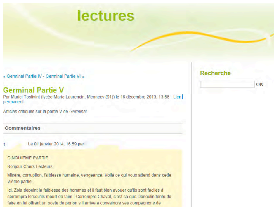
Figure 1. Capture d'écran du forum de l'enseignant A hébergé par l'Académie de Versailles ( http://blog.ac-versailles.fr 8 , récupérée le 20/12/2014)

L'enseignant B, dans un lycée fréquenté par des élèves de milieux défavorisés, a conduit au second niveau un projet de participation au « prix littéraire d'Île-de-France ». L'exploration de cinq ouvrages récents, dans le but de choisir celui auquel la classe donnera sa voix au moment du vote, s'est poursuivie pendant plusieurs mois, lors de séances hebdomadaires en salle équipée de postes informatiques. À chaque rencontre, un temps d'échanges à l'oral a précédé l'écriture de billets sur un tableau virtuel Padlet par livre ; les élèves pouvaient intervenir à propos d'un ou de plusieurs livres.