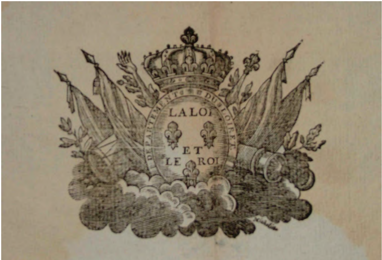
Illustration 2 : L'image du décret de l'Assemblée nationale du 21 Juin 1791, « Au sujet de l'enlèvement du Roi et de sa famille »

d'étude de documents à partir des documents des archives du Loiret et pour Les Rendez-vous de l'Histoire de Blois de 2007 dont le thème était : « L'Opinion : information, rumeur et propagande ». L'image utilisée (voir illustration 2) doit permettre de répondre à la question sept : « Quels sont les deux pouvoirs nationaux qui apparaissent dans ce document ? » La réponse attendue par l'enseignant est : « Le pouvoir législatif ("la loi") et le pouvoir exécutif ("le roi"), représenté par les fleurs de lys, la couronne, le sceptre et la main de justice. Comme le souligne l'ordre des mots utilisés c'est le législatif qui a la prééminence sur l'exécutif. » L'image du décret est utilisée dans cette séquence pour rappel des pouvoirs en France à l'époque, elle n'est pas analysée comme moyen de comprendre la fiction de l'enlèvement créée pour l'Assemblée afin d'éviter une crise institutionnelle 8 . Le document iconographique est cependant présenté, ce qui permet une première lecture de l'image avec le relevé des symboles (la fleur de lys, par exemple). L'auteur, de fait, utilise la grille de Gervereau pour la description technique et en partie thématique, mais il n'y a pas de relation entre l'image et le texte.